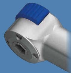
Быстрозажимная скоба Уменьшенный профиль головки отвертки