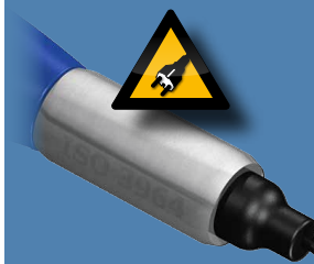
Совместима с источниками питания