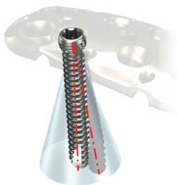
1 изменение направления винта -НЕПРАВИЛЬНОЕ