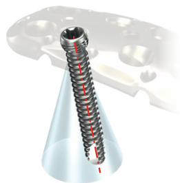
Начальное введение винта -НЕПРАВИЛЬНОЕ